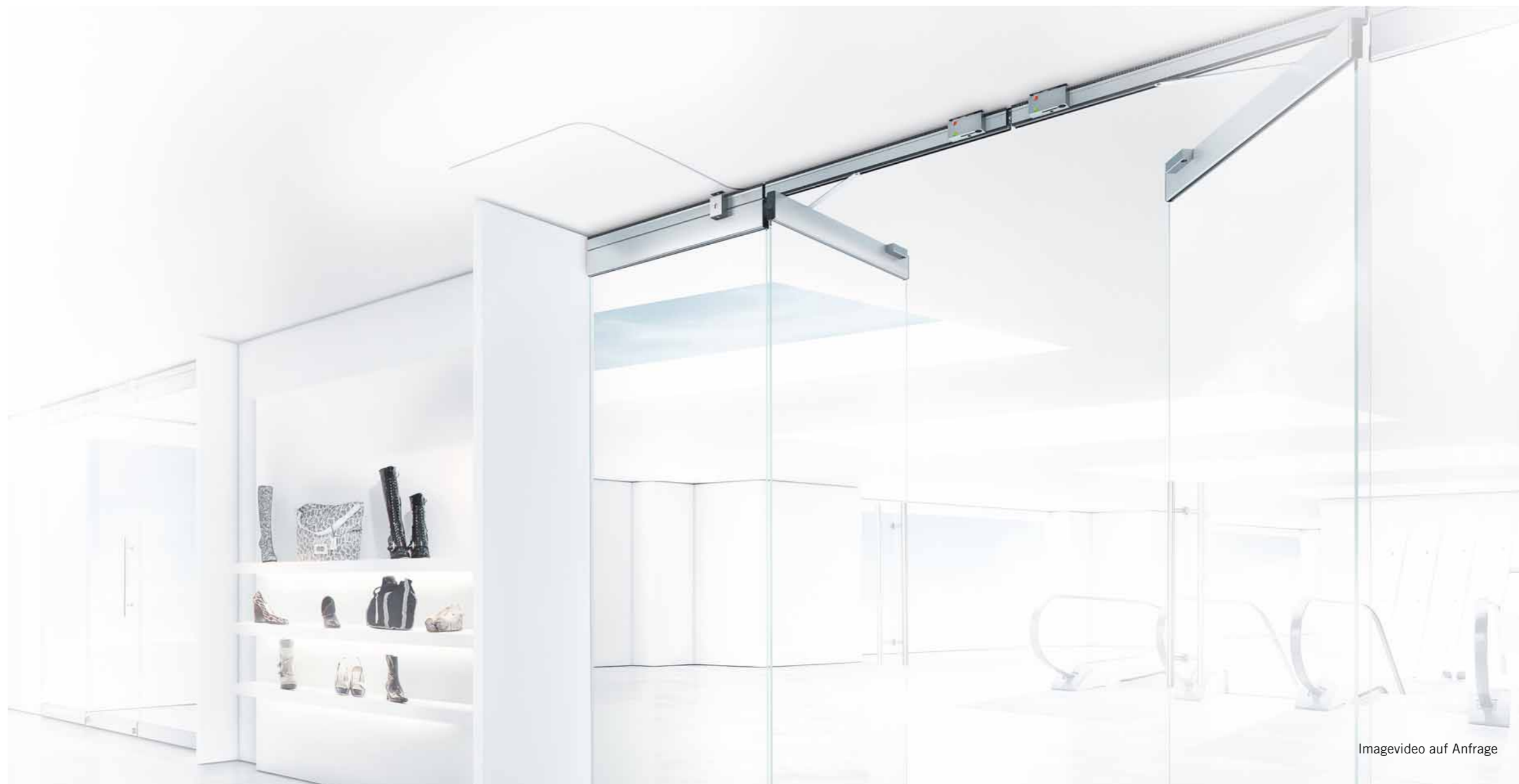
Imagevideo auf Anfrage

Sicher in der Anwendung, elegant im Design. Die verbesserte horizontale Schiebewand.