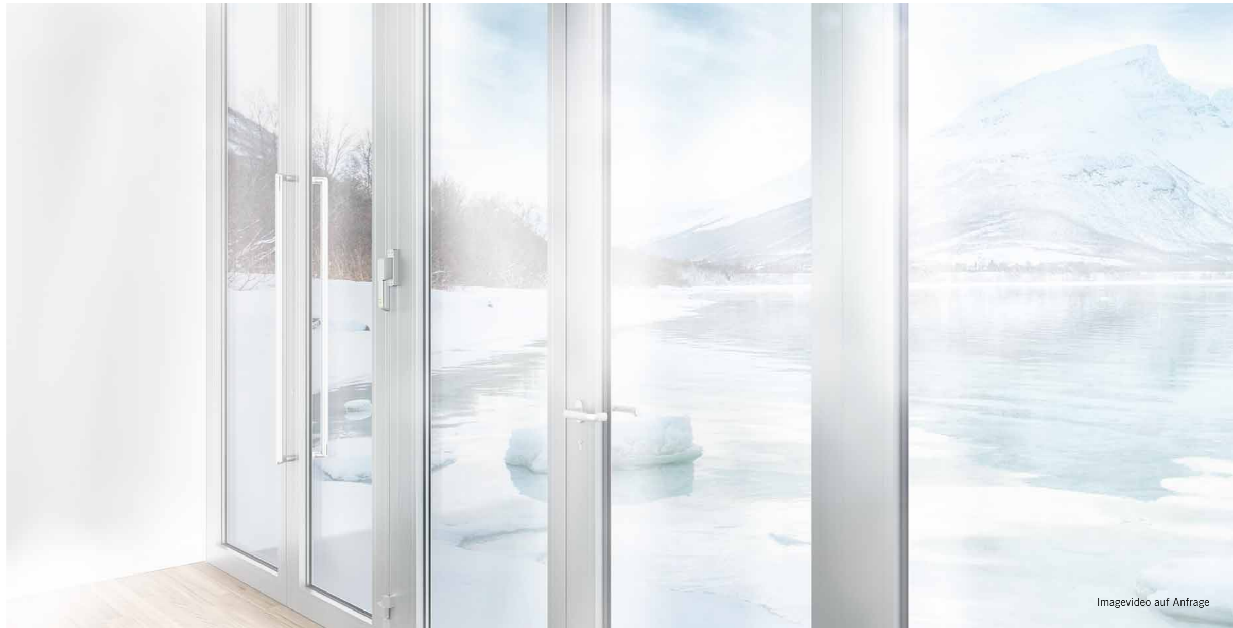
Imagevideo auf Anfrage

Das horizontale Schiebewandssystem für thermische Trennung mit einem Griff.